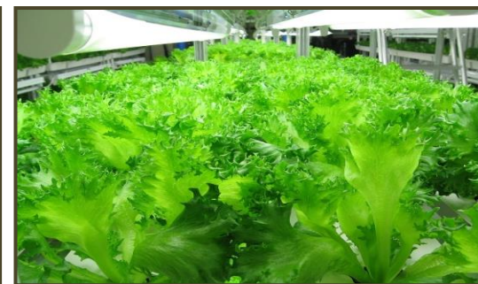
(水耕栽培にて機能性レタスを栽培)