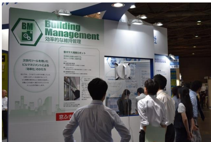
窓ガラス清掃ロボの実演