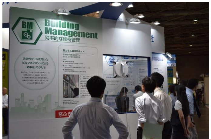
BM (窓ガラス清掃ロボット)