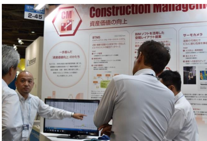
CM (Construction Management) コーナー