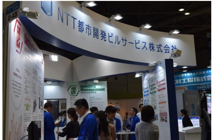
プレゼン終了後のブース