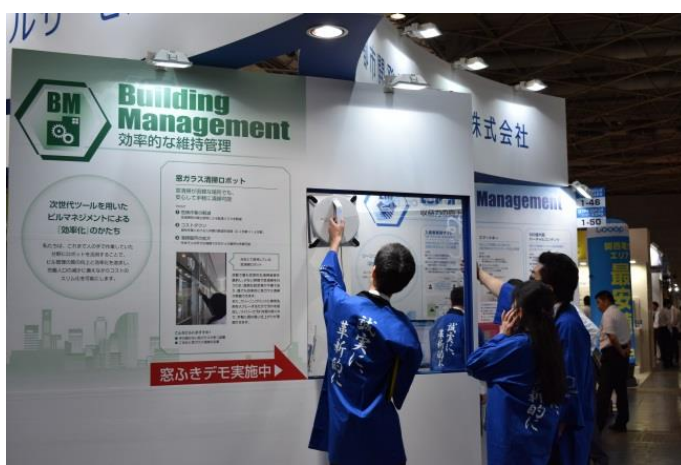
BM (Building Management) コーナー