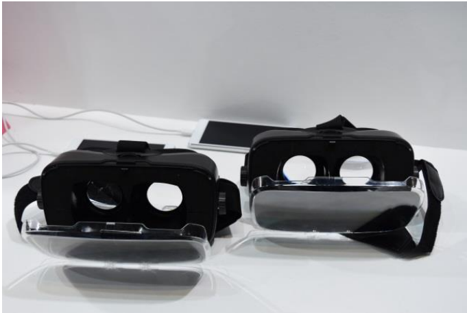
LM (360度内覧コンテンツ)