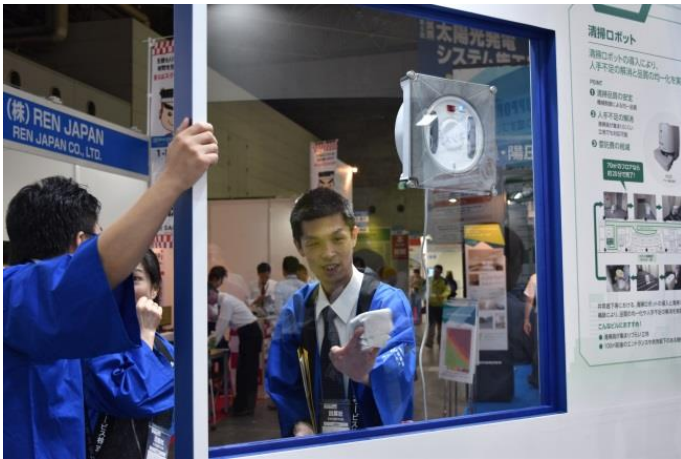
BM (窓ガラス清掃ロボット)