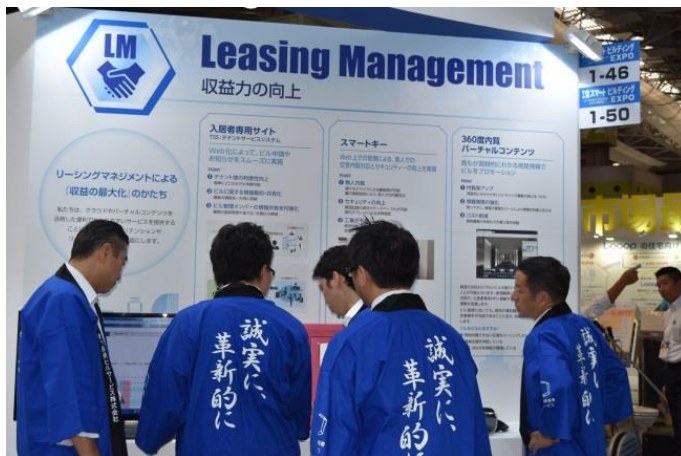
LM (Leasing Management) コーナー