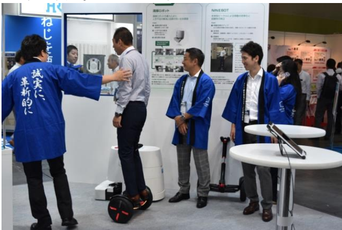
BM (NINEBOT : 近未来型ビークル)