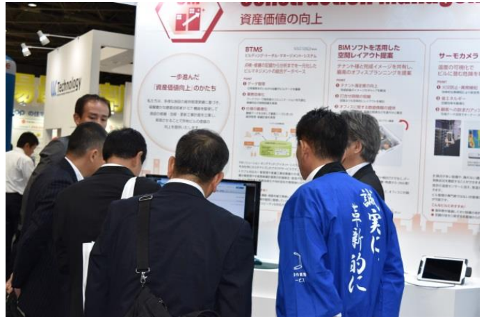
CM (BTMS : ビルディング・トータルマネジメントシステム)