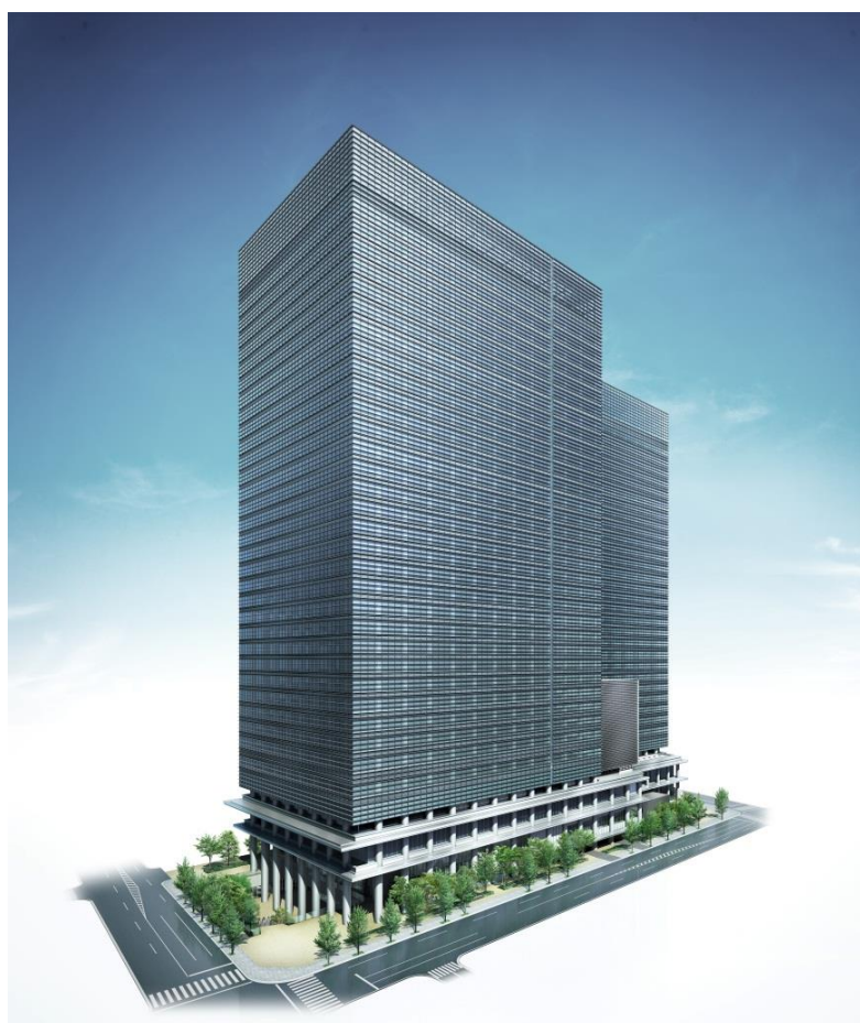
完成予想図（南西側から見る）